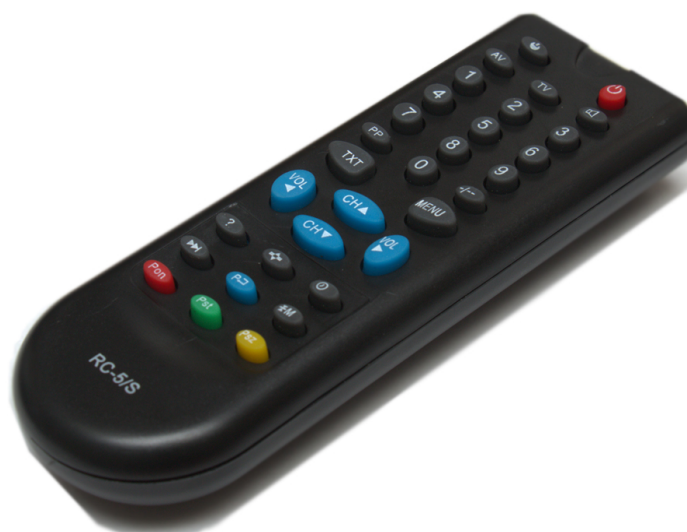
Рисунок 2 – Пульт RC-5/S

Конструктивно устройство выполнено на двусторонней печатной плате из фольгированного стеклотекстолита. Через USB-разъем устройство подключается к ПК.